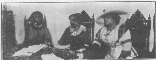
El feminismo en Cuba.—Presidencia de una Junta popular celebrada en esta ciudad con motivo de los primeros brotes del feminismo.

Inútiles han resultado siempre los esfuerzos de los pocos hombres inteligentes y previsores que oponiéndose á la corriente de ironía han tratado de llevar las cosas á un terreno firme de discusión doctrinal y de argumentación seria y meditada; el feminismo no es en suma más que un gusto que protesta de una inmensa porción de la humanidad injustamente considerada en minoría de edad é incompleto desarrollo mental y anímico. Hasta alguien bien documentado ha escrito un notable libro en el que se trata de probar "La Inferioridad mental de la mujer". Esa inferioridad es circunstancial, no congénita. Para los esfuerzos de la inteligencia, para las labores artísticas y aún para la lucha brutal por la existencia, la mujer en todos los países ha dado pruebas repetidas de su capacidad, de su energía, de su perseverancia. Heroica muchas veces en los horrores de la guerra, abnegada casi siempre en las pruebas silenciosas pero duras y crueles del hogar, se eleva á las más altas cumbres del arte si tañe la lira, si maneja el pincel, y aún entra con paso firme y mirada genial en las fórmulas laborísticas de la ciencia. Crea y organiza; infunde alientos y da ejemplo de abnegación y perseverancia y allí donde el medio social ó la legislación ensancha el campo de su actividad revela do-