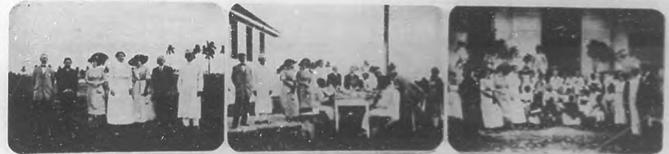
El año nuevo en Mazorra.—Reparto de juguetes á los pequeños desahucados.

Que halle fuerzas para resignarse le deseamos sincera-