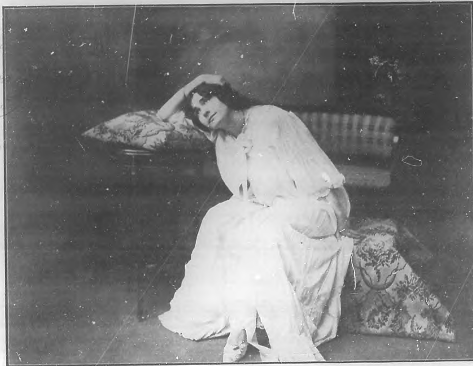
Señorita Josefina Roca en "La Dama de las Camelias".—Notable actriz dramática que habrá de actuar en el Gran Teatro del Politeama en el próximo mes de Febrero.