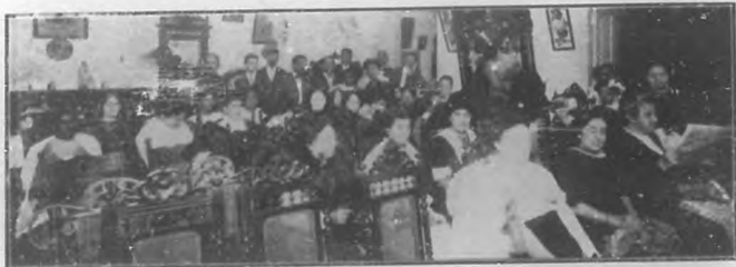
El feminismo en Cuba.—Una vista de la concurrencia.

tes muchas veces superiores al promedio masculino. Preparar el medio y modificar la legislación para que encuentre la mujer antes estímulos que barreras es dar acceso á un elemento que si quiera por su número puede prestar servicios incalculables á la causa del progreso y del bien. En los E. Unidos la emancipación femenina es de larga fecha un hecho consumado y aún ha llegado á alcanzar el derecho del sufragio. País nuevo, abierto á todos los progresos, las barreras fatídicas de los intereses creados, han sido en la vecina república menos resistentes que en E.