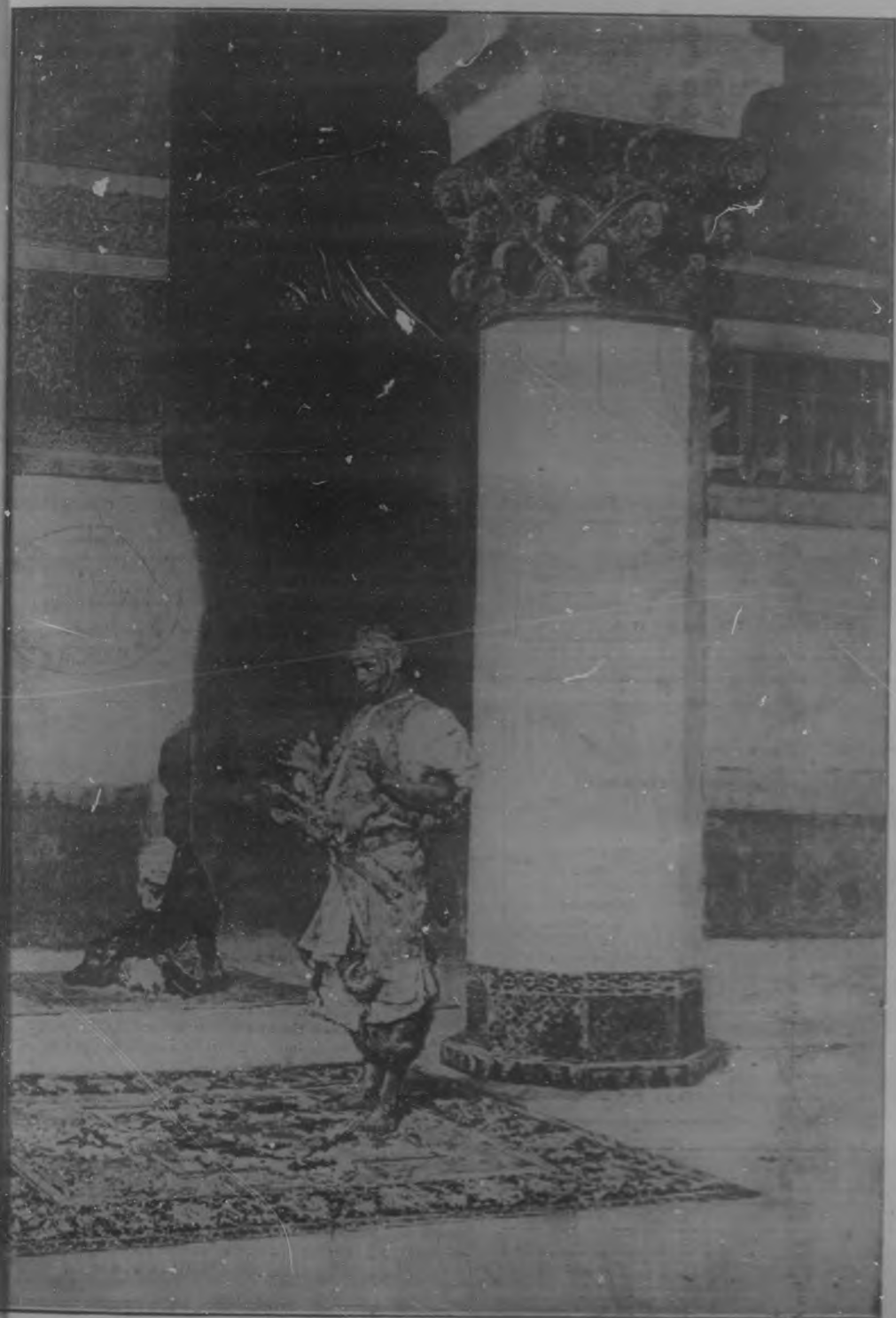
LA PLEGARIA EN LA MEZQUITA. Cuadro de Mariano Fortuny.